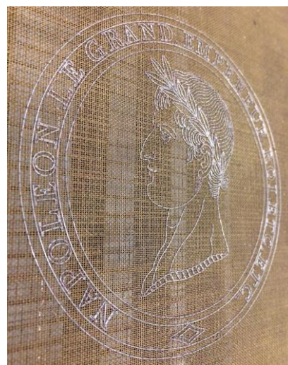
Filigrana di Napoleone, 1812

La storia della famiglia Magnani, antica famiglia di imprenditori cartari e del suo legame con Pescia, inizia da lontano. Nel 1783 il capostipite Giorgio Magnani si trasferisce a Pescia e dà avvio alla fortunata attività imprenditoriale che si è protratta fino ai nostri giorni. E' ai primi dell'800 che la posizione della ditta "Giorgio Magnani e figli" si consolida: è proprietaria di cinque cartiere, ne ha in affitto altre tre e lavora alla costruzione di un nuovo fabbricato oltre a gestire una stamperia e un setificio e dà lavoro, in maniera diretta, a circa ottanta famiglie della zona. Sempre nello stesso periodo la "Giorgio Magnani e figli" diventa il fornitore degli uffici del Demanio di tutti i Dipartimenti Italiani e, nel 1812, ottiene l'autorizzazione per fabbricare carta con la filigrana di Napoleone e Maria Luisa d'Austria.